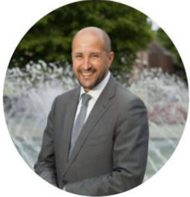
Voorzitter Ahmed Marcouch Burgemeester gemeente Arnhem