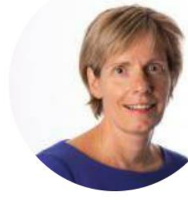
Helga Witjes Gedeputeerde Provincie